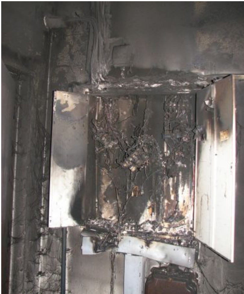
Nach Kabelbrand ausgebrannter

Sicherungskasten