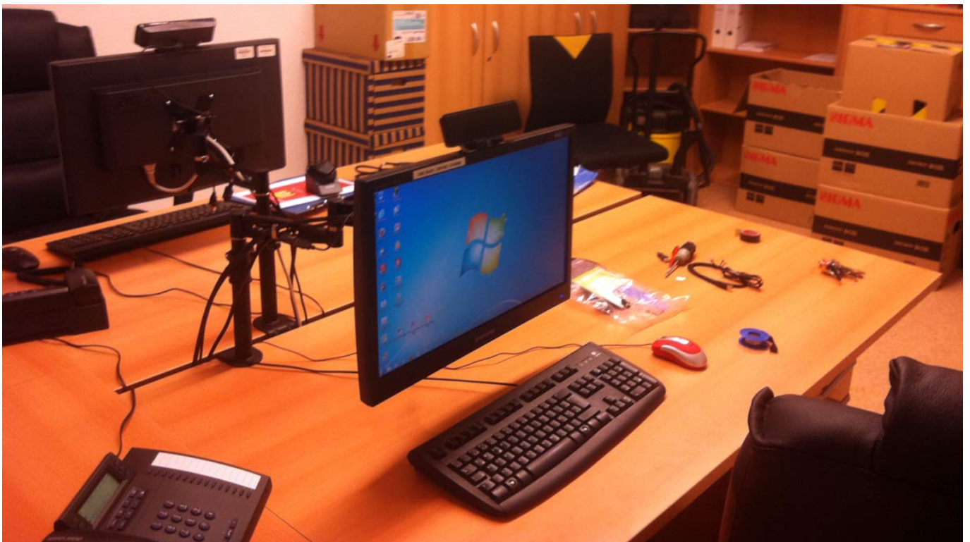
_ Die Arbeitsplätze stehen