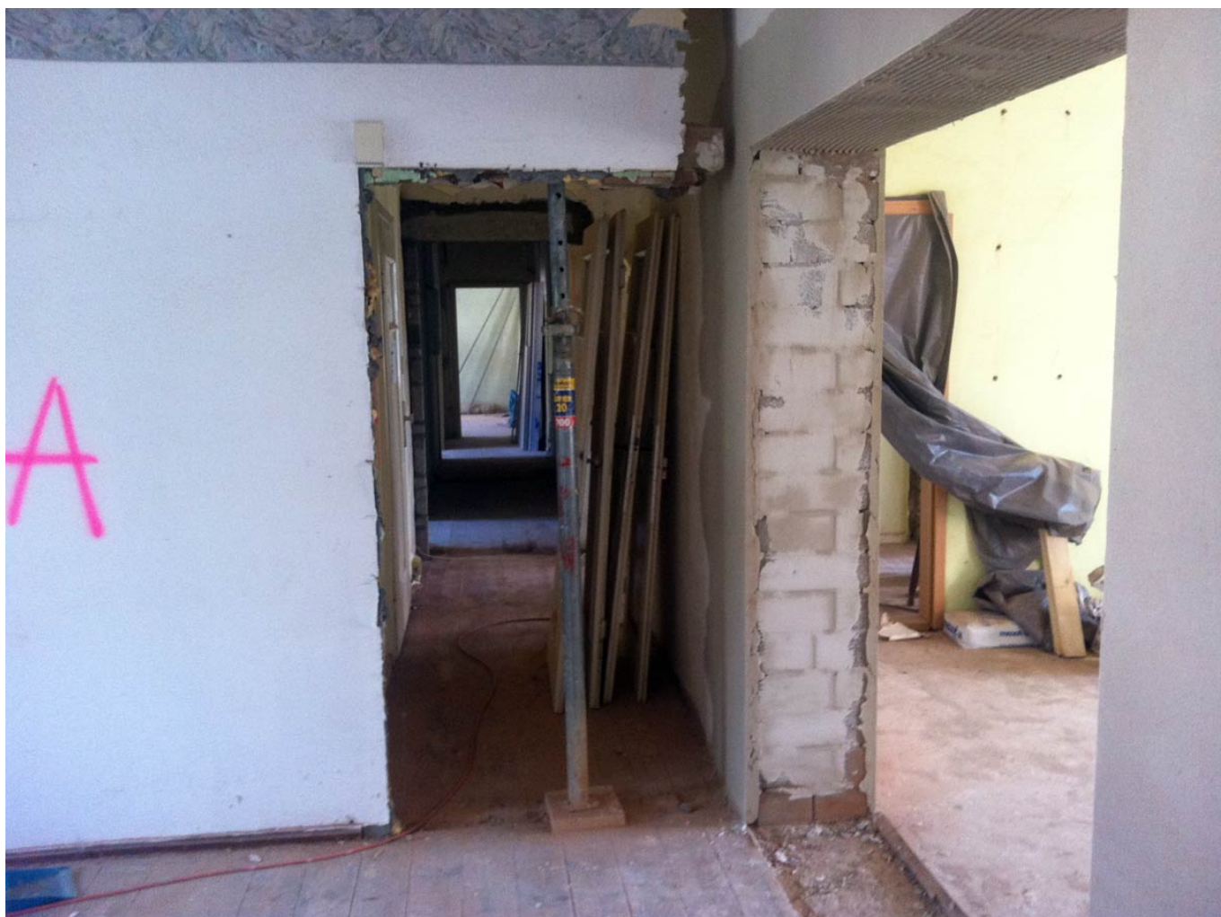
Die Durchbrüche sind geschafft