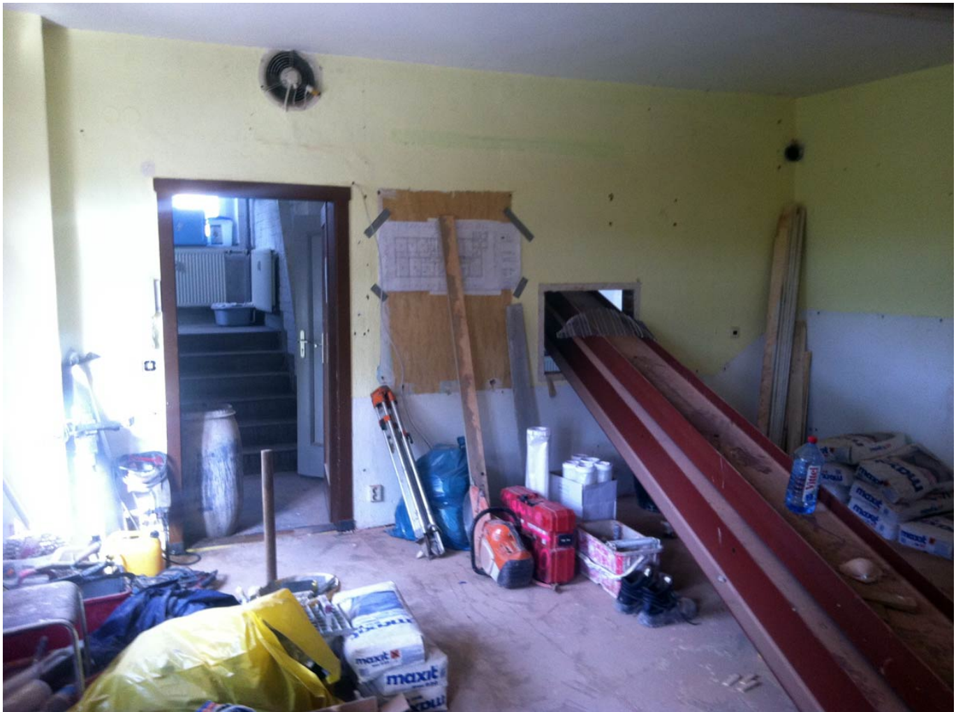
Eisenträger einmal quer durch den Raum