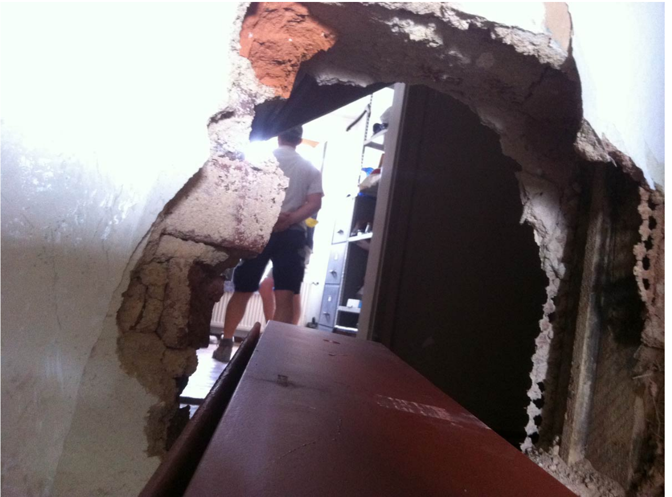
_ Damit die Träger dorthin kommen, wo sie hinsollen, musste die Wand aufgemacht werden