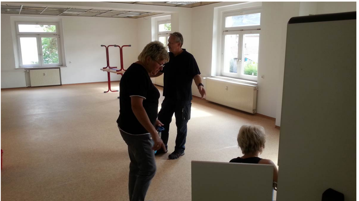
_ Dann hieß es: Putzen, putzen, putzen...