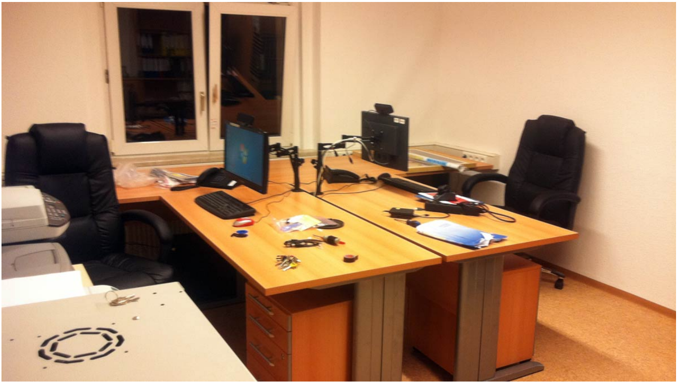
_ Die Büros werden eingeräumt