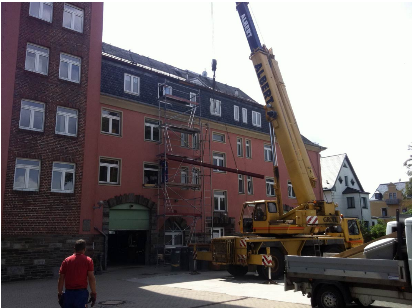
— Schwere Eisenträger werden angeliefert