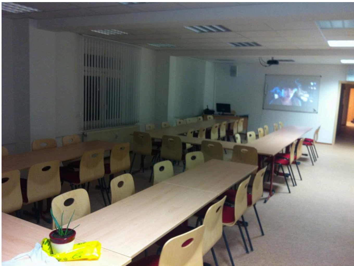
_ Schulungsraum 1 vor der ersten Nutzung