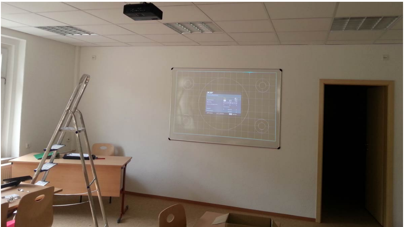
Noch mehr Technik