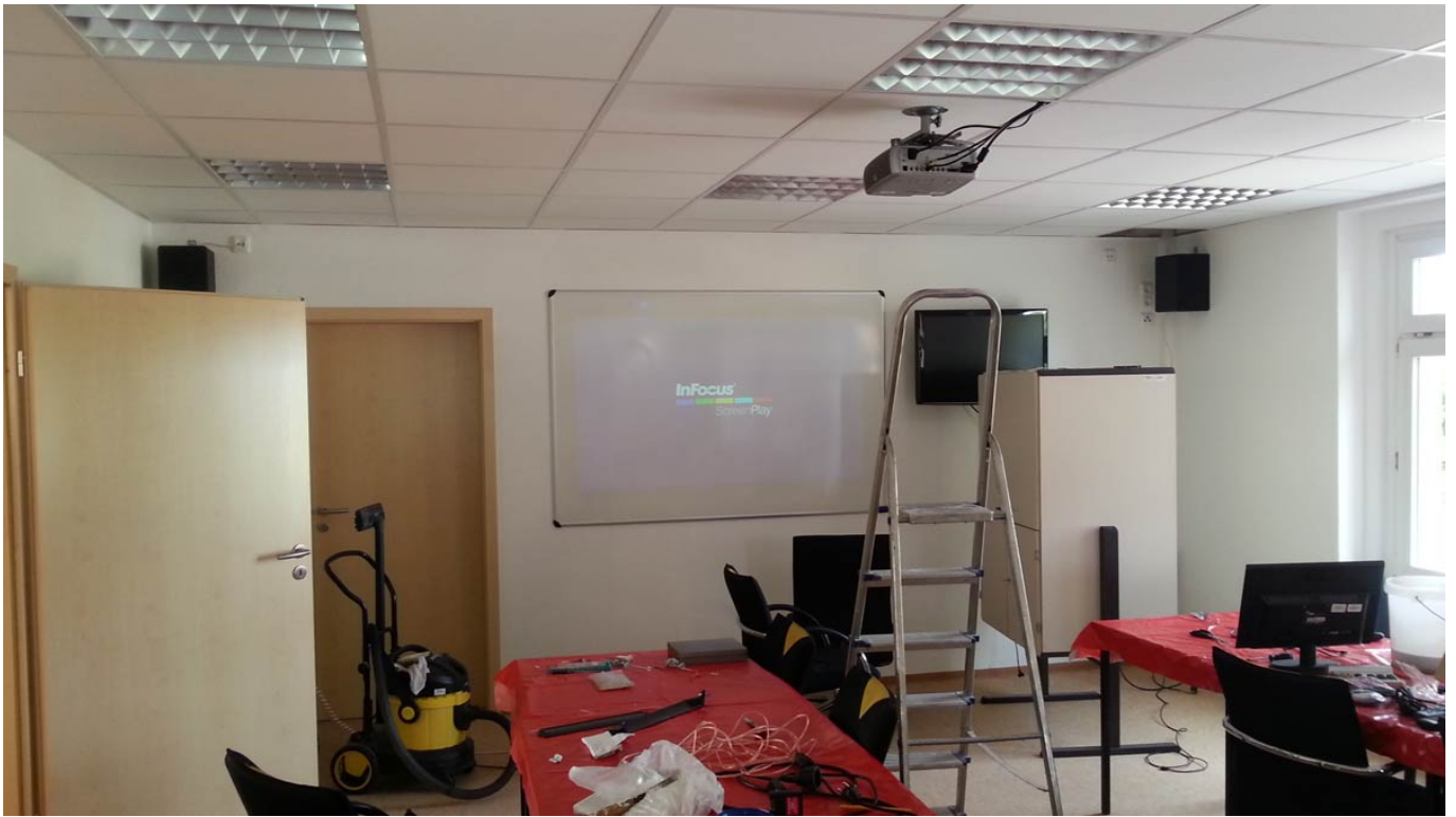
Die Technik wird installiert