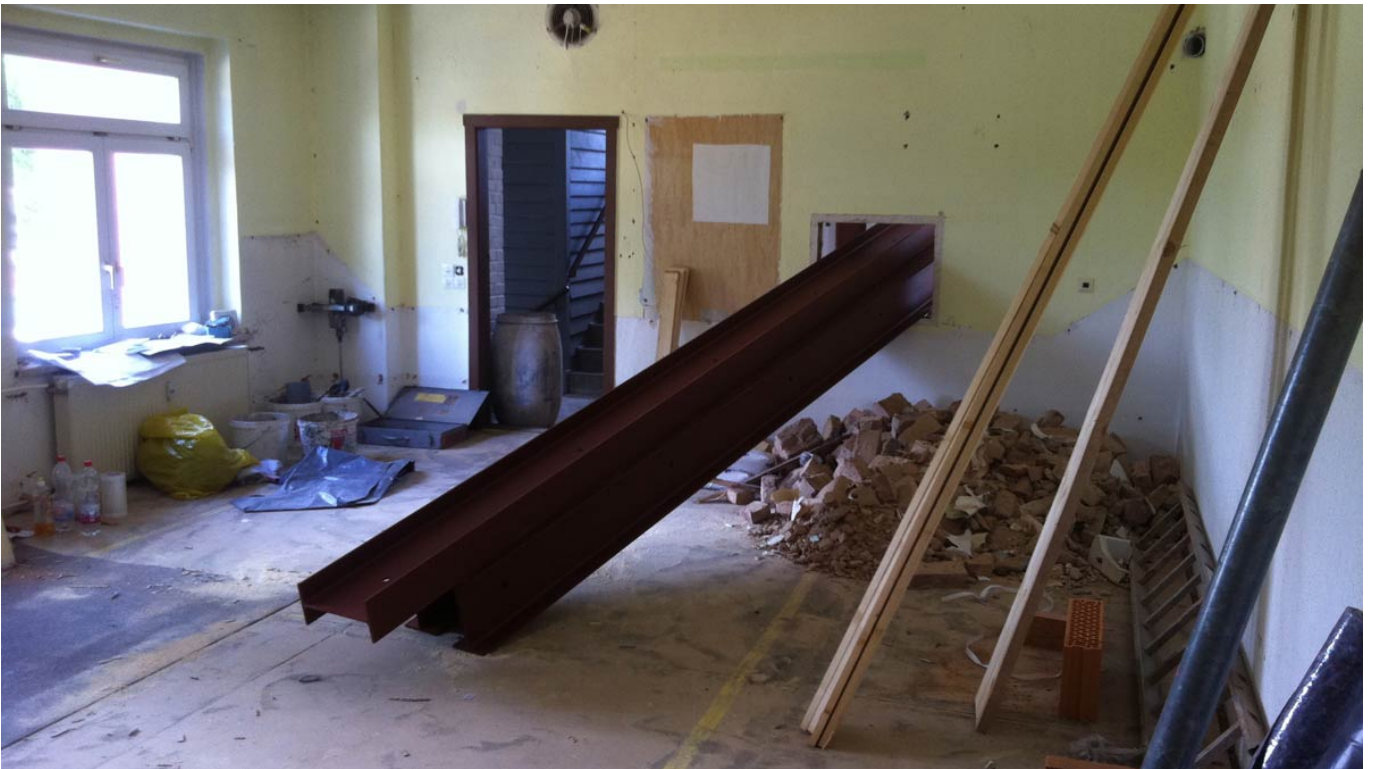
Der Fußboden wird gelegt - Bildrechte: FF Lugau