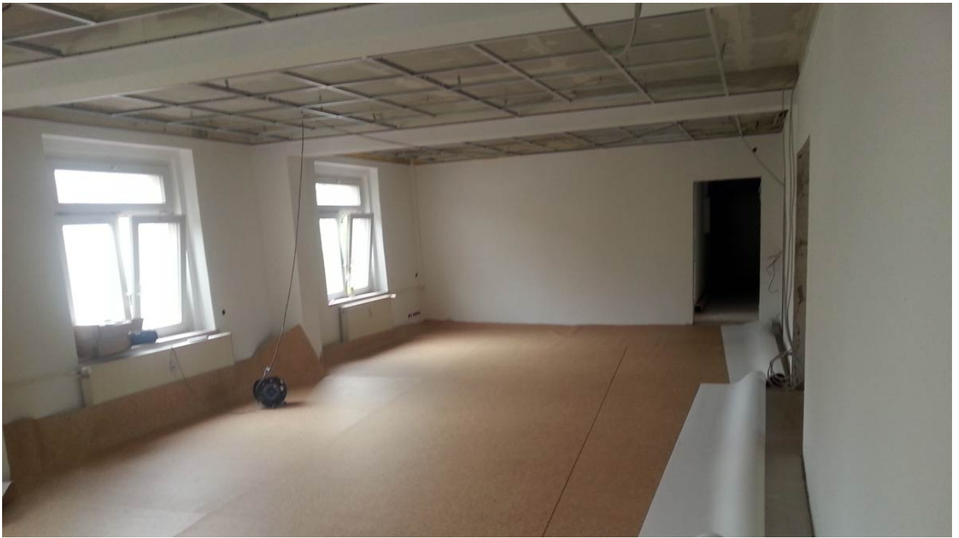
_ Der Fußboden wird gelegt